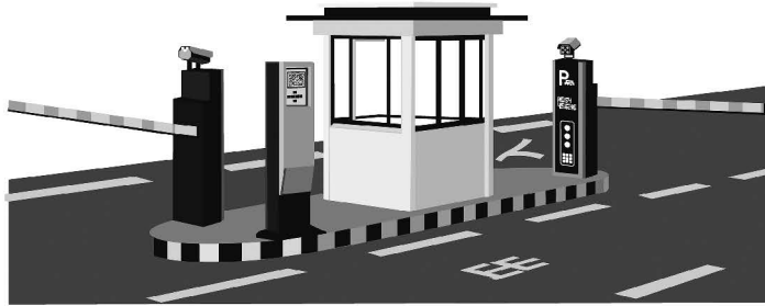
图 2 智慧停车系统场景示意图

车辆进入停车场，智慧停车系统通过监控摄像头拍摄车辆，自动识别车牌号后放行；离开前，驾驶员通过手机扫描收费二维码，自助缴纳停车费后方可离场。智慧停车系统场景如图 2 所示。